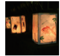
富士開山まつり・あかり絵 6月27日

主催: 人着物連 にんきものれん 協力: 一般社団法人 富士宮市地域力再生総合研究機構 まちなかアートギャラリー実行委員会 後援: 富士宮市観光協会 特別協力: 富士宮信用金庫 神田支店