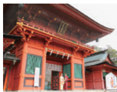
富士山本宮浅間大社